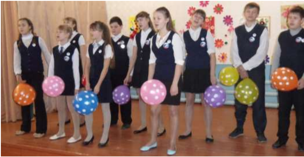
Посвящение в РДШ