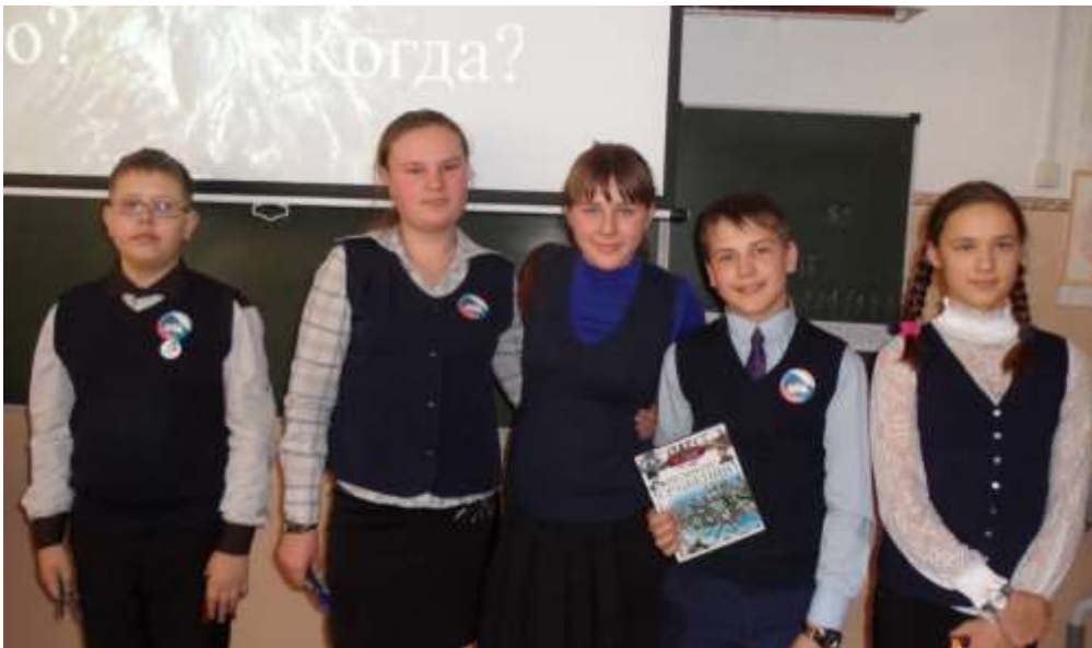
Интеллектуальная игра «Что? Где? Когда?»